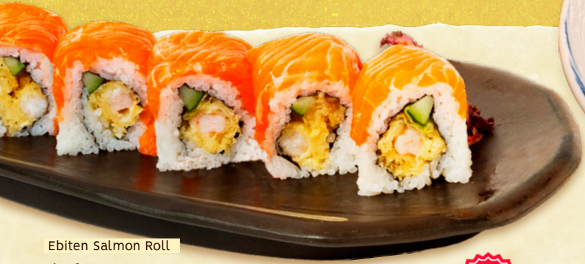
Ebiten Salmon Roll 海老天 サーモンロール SHRIMP TEMPURA SALMON ROLL RM35