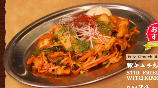
Buta Kimuchi Itame