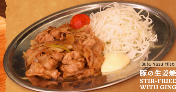
Buta Nasu Miso Itame

豚の生姜焼き STIR-FRIED PORK WITH GINGER SAUCE RM24