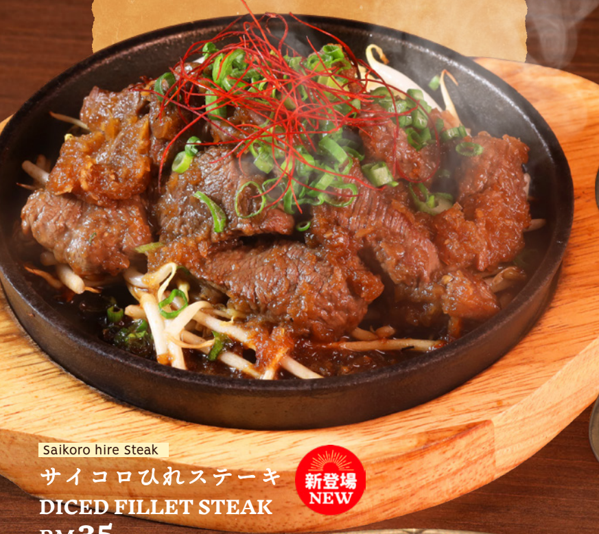
Saikoro hire Steak