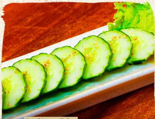
Kyuri Ippon Zuke