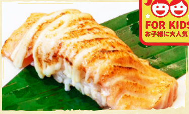
Aburi Mayo Salmon Nigiri サーモン炙りマヨ SALMON WITH TORCHED MAYONNAISE RM6