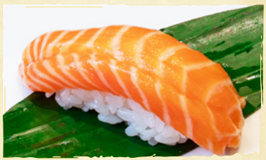
Salmon Belly Nigiri サーモンベリリー SALMON BELLY RM5