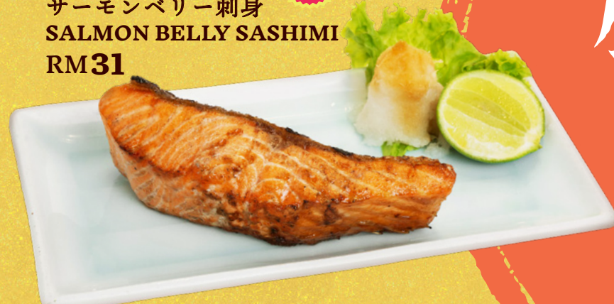
Salmon yaki サーモン焼き GRILLED SALMON RM22