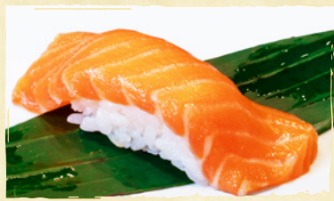
Salmon Nigiri サーモン SALMON RM5