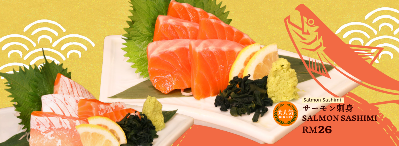
Salmon Sashimi サーモン刺身 SALMON SASHIMI RM26