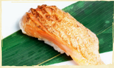
Aburi Salmon Nigiri サーモン炙り TORCHED SALMON RM5