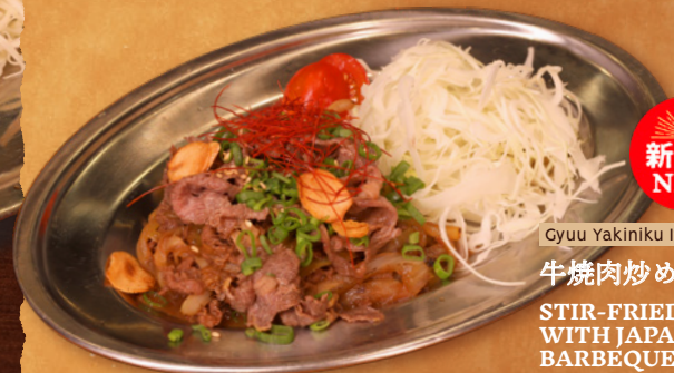
Gyuu Yakiniku Itame

豚焼肉炒め STIR-FRIED PORK WITH JAPANESE BARBEQUE SAUCE RM24