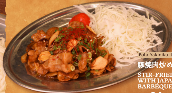
Buta Yakiniku Itame

豚焼肉炒め STIR-FRIED PORK WITH JAPANESE BARBEQUE SAUCE RM24