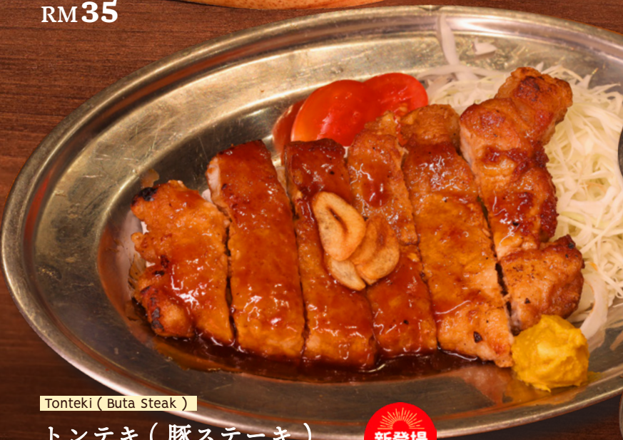
Tonteki (Buta Steak)

トンテキ (豚ステーキ) GARLIC PORK STEAK WITH SAVORY BROWN SAUCE RM26