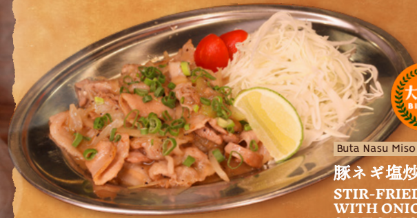
Buta Nasu Miso Itame

ご飯 Rice 味噌汁 Miso soup ミニサラダ Mini Salad お漬物 Pickles